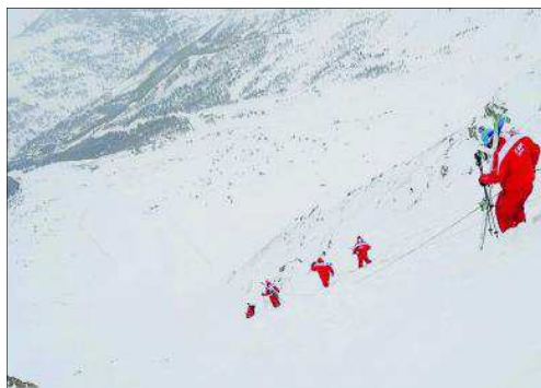
Des cordes pour se rendre au départ.