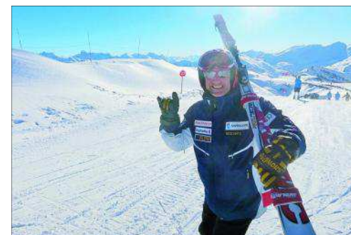
Les yeux brillent après deux ans d'absence!