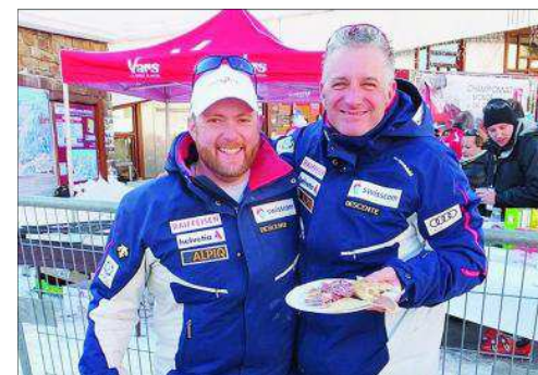
On se rassasie après la course.