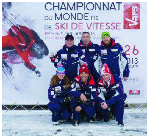
La délégation suisse à Vars.