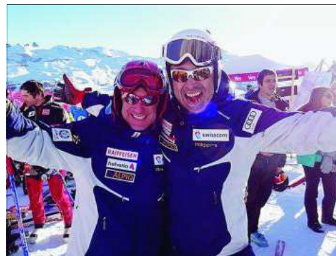
Ambiance super dans l'équipe de KL.